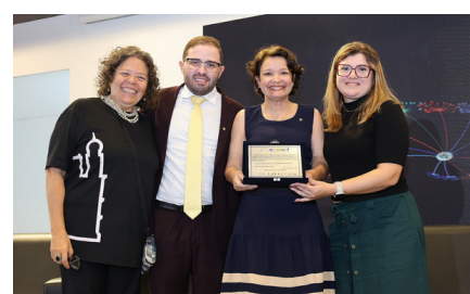
NUCLEADORA FIOCRUZ CEARÁ