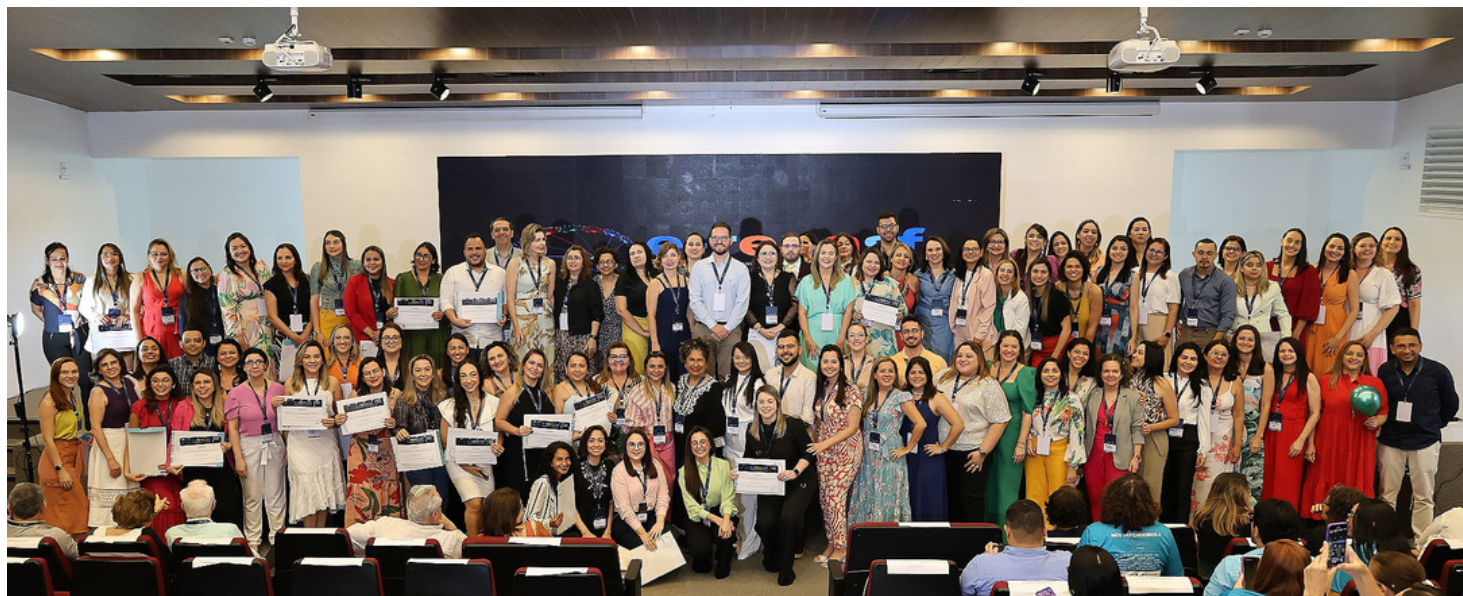
4ª turma de mestres do PPGSF/RENASF

Dois dias de encontro para reforçar a importância