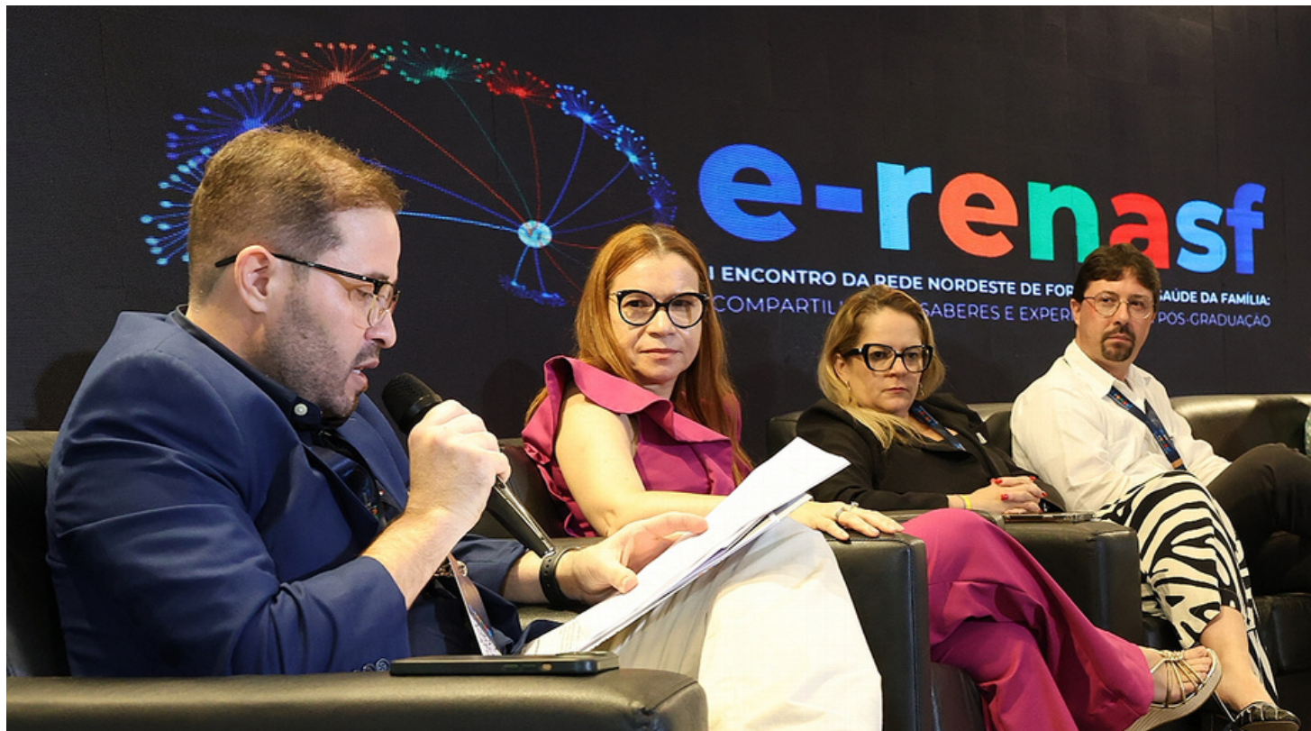
Coordenador Geral do PPGSF anuncia edital para a 5ª turma do mestrado