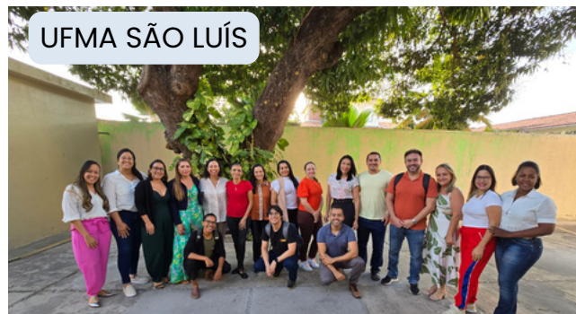
UFMA SÃO LUÍS